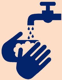
TOUTOU FANOFANO E NIMÁ 'AKI HA KOA MO E VAI

Ko e malu'i lelei taha ki hono ta'ofi e fakamafola e mahaki ko hono fakahoko lelei hono tauhi e haisini: