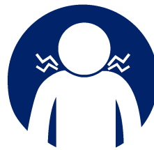
MAMAHI E MONGÁ