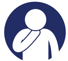
FAINGATA'A'IA E MĀNAVÁ