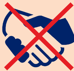
FAKA'EHÍ'EHI MEI HE FEOHI VĀOFI MO HA NI'IHI KEHE