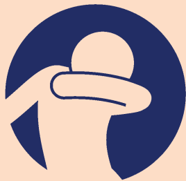
'UFI'UFI HO NGUTÚ HE TAIMI 'OKU KE TALE PE MĀFATUA AÍ